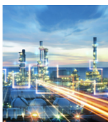
Oil & Gas