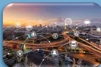
Centro Studi & Comunicazione