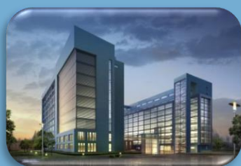
Clinical Trial Centers (CTC)