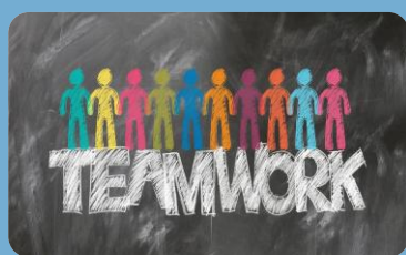
Tavolo permanente di confronto