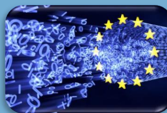
Sicurezza dati | GDPR